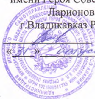
График проведения открытых классных часов на 2019-2020 учебный год.