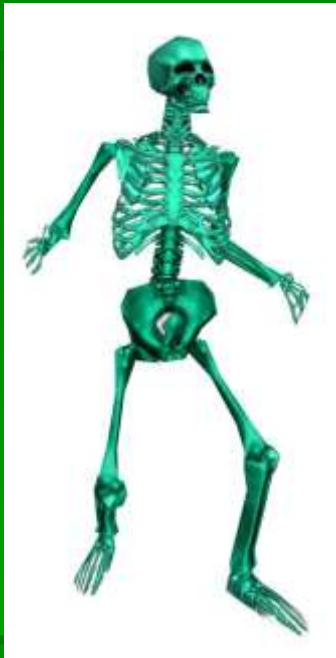
Анорексия (чрезмерное похудение)

Правильное питание влияет на развитие тонуса в организме и дает дополнительную энергию для работы мозга. А неправильное питание может привести к ожирению, анорексии и другим болезням, таким, как сахарный диабет и язва желудка.