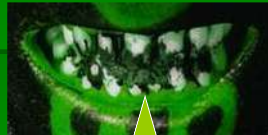
Запущенный уход за зубами

Конечно, посещение врача-дантиста – процедура не из приятных. Но благодаря ей наши зубы здоровые и красивые. Также важно чистить зубы по утрам и вечерам, чтобы их не поразил кариес.